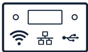
KONTROLLTAFEL mit Telematik

Die neue Generation bewährter und wirksamer Saugtechnologie, jetzt mit höherer Saugleistung und einfacherer Wartung.