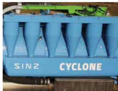
Original SINZ Zyklonsystem