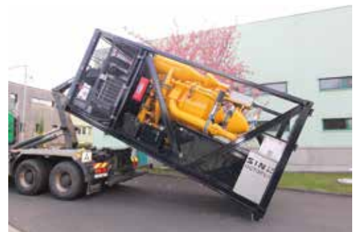
Varianta ABROL kontejneru.