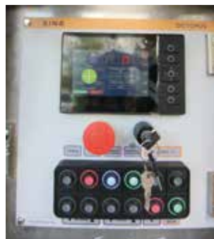
Intuitivní ovládací panel SINZ.