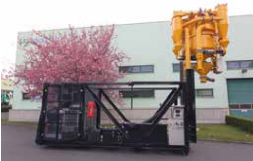
Velký zdvih zásobníku.