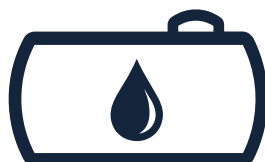
KAPACITA NÁDRŽE až 16 m 3