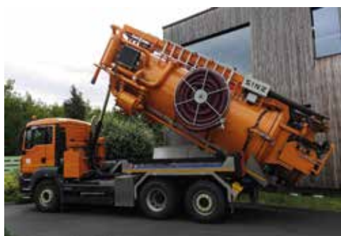
Velká kapacita cisterny