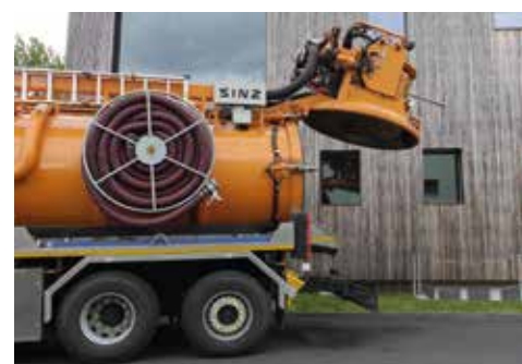
Naviják sací hadice s kapacitou 25m s průměrem 100mm