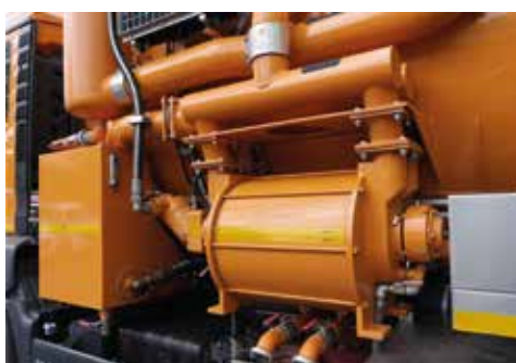
Vakuová vývěva SINZ 4200 m 3 / h