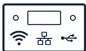
CONTROL PANEL s telematikou

Ověřená technologie pro řešení přepravy odpadů a čištění špatně dostupných prostorů.