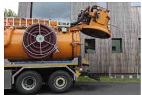
Saugschlauchhaspel mit einer Kapazität von 25m DN 100mm